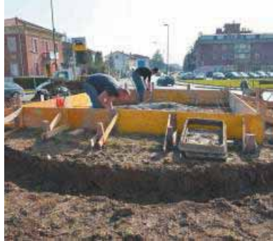
I lavori al basamento del monumento

CASALMAGGIORE — E' ormai definitivo il programma della grande giornata dedicata alla 'Città del Bijou', programmata per sabato 8 marzo, festa della sonna. E, alla vigilia dell'esposizione dei manifesti, ecco il bozzetto di come sarà la scultura dedicata al Bijou opera dell'artista Bruno Buttarelli che sarà posata nel mezzo della rotatoria all'ingresso di Casalmaggiore, vicino alla scuola media 'Diotti'. La giunta comunale ha dato il via libera al piano di tutte le iniziative, il Consiglio comunale ha recentemente riconosciuto l'eccellenza storica di Casalmaggiore nella produzione di bigiotteria mentre i lavori al basamento che ospiterà la scultura-monumento — donata dal Lions Club a ricordo dei 40 anni di fondazione e pronta in un capannone di Rivarolo Mantovano — sono già in stato piuttosto avanzato tra via Beduschi e via Roma.